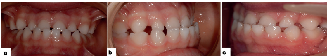
Rycina 2. Zdjęcia wewnętrzne: a) widok z przodu, b) strona prawa, c) strona lewa.

Figure 1. Extraoral photographs: a) en face, b) profile, c) 3/4 profile.